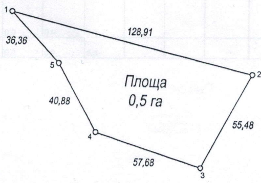
Таблиця координат меж контуру ділянки *